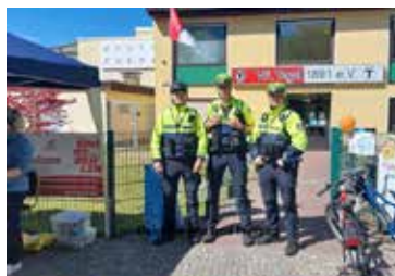
Auch unsere Freunde und Helfer cadetten mit und sorgten für die Sicherheit unserer Teilnehmer.