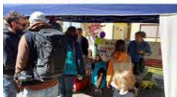
Eine Stärkung wird immer gerne angenommen!